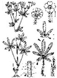
Aufrechtes F - P. recta 1.117-1.200 3-4-6 (Walt.)

Das Aufrechte Fingerkraut ( Potentilla recta ) tauchte in den letzten Jahren vermehrt in Baden-Württemberg auf und wurde an geeigneten Stellen auch bei uns heimisch, z.B. bei der Gutenhalde. Diese ursprünglich osteuropäisch-westasiatische Pflanze, hat ihr Verbreitungsgebiet, wie noch einige andere Arten der kontinental geprägten Steppengebiete des Ostens, nach Westen bis in unseren Raum ausgedehnt.