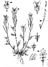
Vierblättriges Schaumkraut - Cardamine hirsuta 1.117-1.200 3-4-6 (Walt.)

Das Behaarte Schaumkraut ( Cardamine hirsuta ) war früher nur aus Gebieten bekannt, wo Weinbau betrieben wurde. Es galt als wärmeliebendes Unkraut der Weinberge. Heute ist es schon im zeitigen Frühjahr praktisch überall als zierliches Wildkraut der Äcker, Gärten und Gebüsch auch in Filderstadt zu sehen. Diese Pflanze ist für viele Naturkenner neu, weil sie aus ihrem ursprünglichen Verbreitungsschwerpunkt, nämlich dem Unterland und dem Oberrhein, sich seit einigen Jahren in einem großen Teil Württembergs ausgebreitet hat.