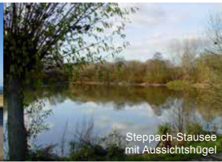
Stausee/Aussichtshügel mit Aussichtshügel