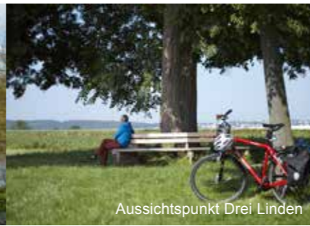
Aussichtspunkt Drei Linden