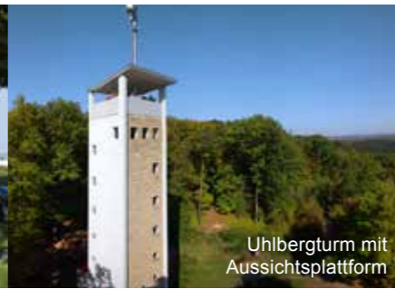
Uhlbergturm mit Aussichtsplattform