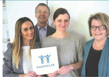
RAUMTEILER und die Haus- und Wohnungstauschbörse (HuWTB)