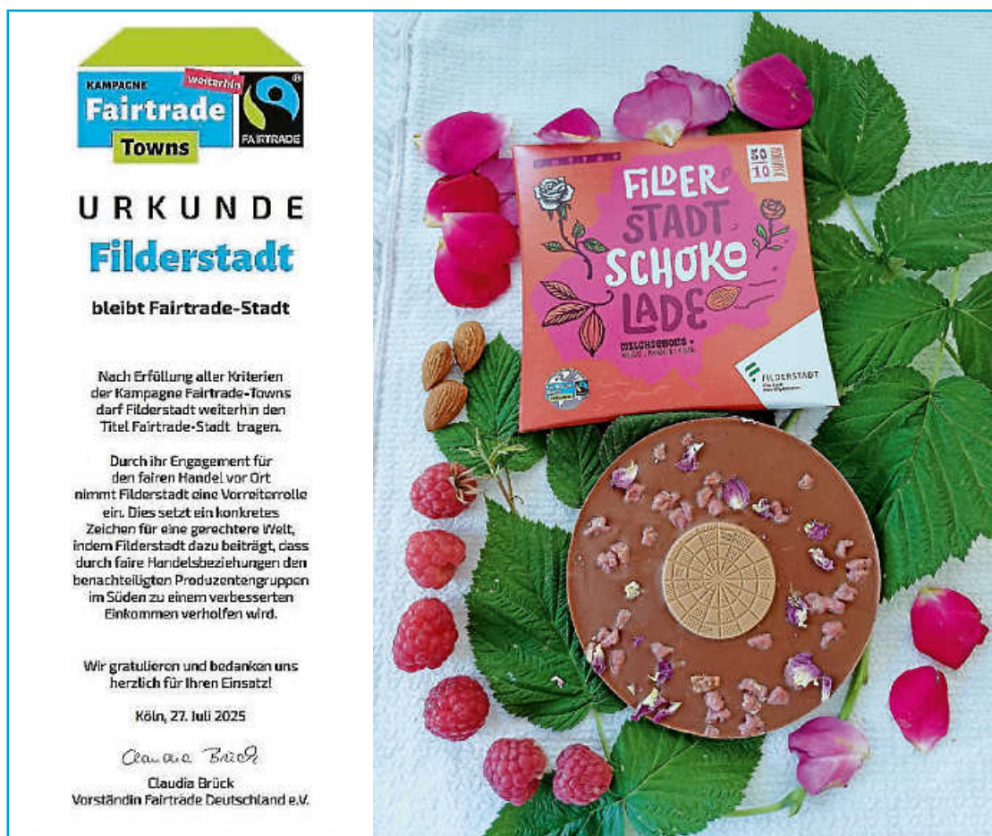
Frisch eingetroffen: die Rezertifizierungs-Urkunde. Daneben: Die neueste Filderstadt-Schokolade bestehend aus Milchschokolade dekoriert mit einer Mandel-Nougat-Scheibe sowie Mandeln umhüllt von Himbeerküvertüre und Rosenblüten.