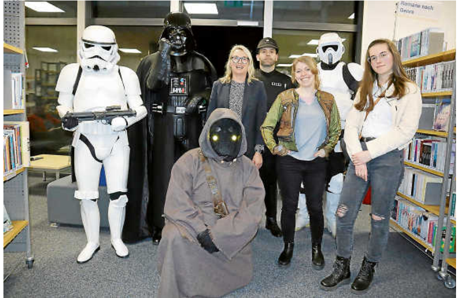
Menschen und Kult-Gestalten aus fernen Galaxien friedlich Seite an Seite.