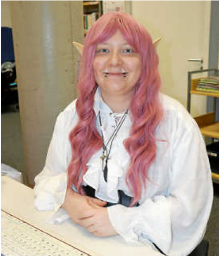
Fortsetzung von Seite 2

der „Langen Nacht der Bibliotheken“ an der Volmarstraße 16 in Bernhausen eine Selbstverständlichkeit, weil die Jungs nach eigenen Angaben sehr gerne lesen und dort jederzeit „neuen Stoff“ (Fantasy-, Abenteuer- und Göttergeschichten) finden.