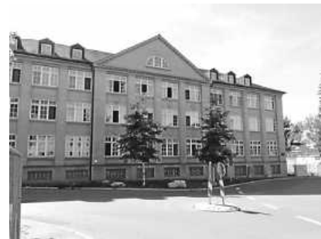
Das bauliche Vorbild für das Plattenhardter Fabrikgebäude („Domberger“) in Reutlingen von 1924.

Auf dem Rückweg unserer Fahrt nach Pfullingen am 1. April gab es in Reutlingen eine kleine Überraschung: Hier steht das bauliche Vorbild für das Plattenhardter Fabrikgebäude Müller & Schneider, Uhlbergstraße 40. Es wurde 1924 durch den Architekten Ludwig Mauer als Textilfabrik Seitz erbaut, das Plattenhardter Fabrikgebäude stammt von 1925 und hat ein nahezu identisches Aussehen (ba).