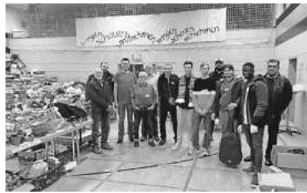
Danke an die Männerriege des Arbeitskreises Asyl für die wertvolle Hilfe.

Das zeigt uns, dass es nach wie vor eine gute und vernünftige Einrichtung ist und auch gebraucht wird.