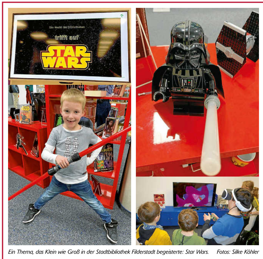
Ein Thema, das Klein wie Groß in der Stadtbibliothek Filderstadt begeisterte: Star Wars.