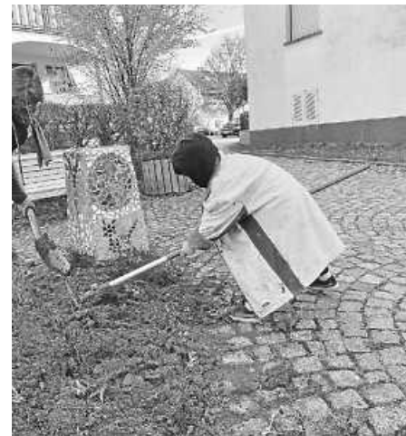
Beetvorbereitung zum Säen