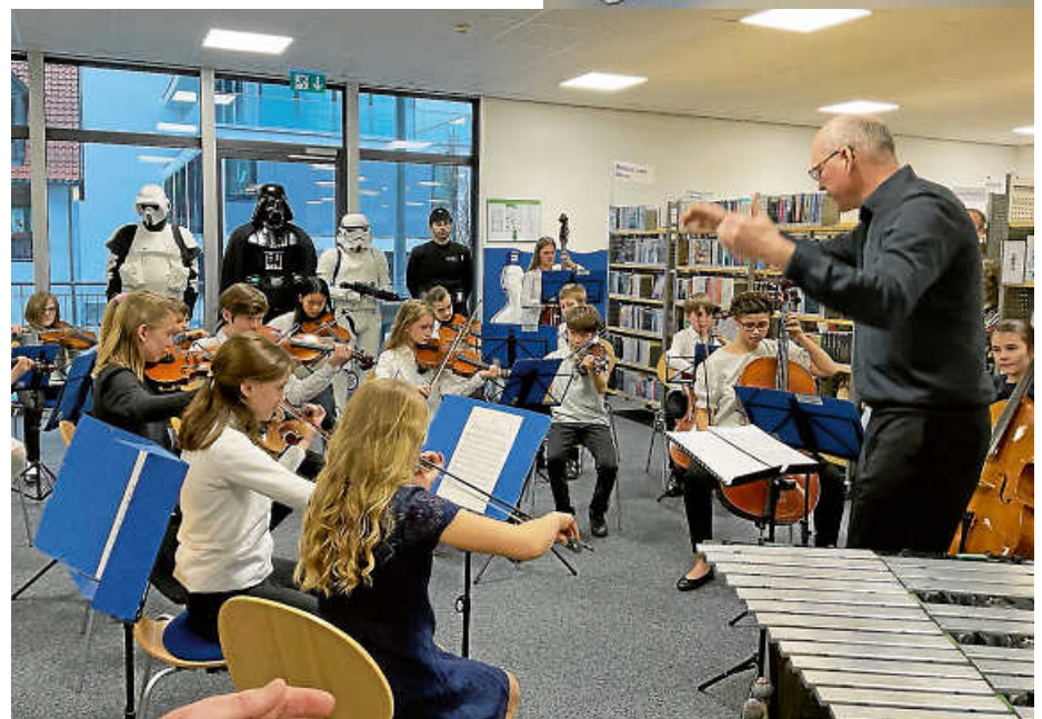
Eine Leidenschaft, viele Fans und Akteure in Bernhausen: das Abenteuer Star Wars.