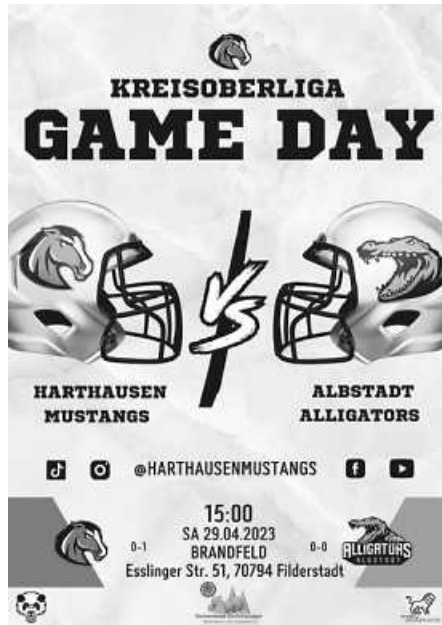
Plakate: Benjamin Petrova