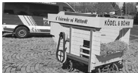
Dreschmaschine und Feuerwehrbus der Freiwilligen Feuerwehr Plattenhardt.

Ausstellung zur Plattenhardter Fuirwehr Am 2. Mai wird die nächste Sonderausstellung im FilderStadtMuseum eröffnet. Aus Anlass des Jubiläums „100 Jahre Freiwillige Feuerwehr Plattenhardt“ erinnert diese Ausstellung an die Historie dieser Feuerwehr, die durch die Geschichte von „D’Fuirwehr vo Plattahardt“ im ganzen Land bekannt ist. Die Eröffnung findet am Dienstag, 2. Mai, um 18.30 Uhr im evangelischen Gemeindehaus Bonlanden mit Oberbürgermeister Traub statt.