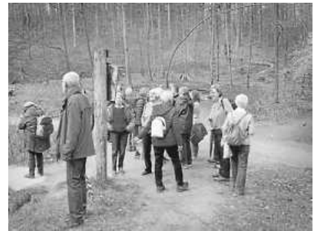
Die NaturFreunde am 19. März auf der Kuckucksweg-Wanderung bei S-Botnang.

Vorsitzender: Herbert Kniebieder E-Mail: filder@naturfreunde.de www.naturfreunde-filder.de Sonntag, 16. April - Bezirks-Frühjahrs-wanderung mit der OG Plochingen-Reichenbach-Lichtenwald. Montag, 17. April, 19 Uhr - Spieleabend im Cafémina in der Alten Mühle, Fi-Bonlanden. Mittwoch, 26. April, 10 Uhr - Mittwoch-Wanderung ab Vereinsheim in Fi-Bernhausen, La Souterrainer Straße 11. Sonntag, 30. April - Die vorgesehene Wanderung „Steillagentour rund um Bietigheims Altstadt“ wird in den September verschoben. (Erika Weber)