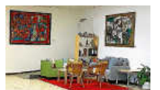
Sofa-Ecke in der Artothek

Zu den Öffnungszeiten können Sie gerne jederzeit vorbeikommen und es sich dort gemütlich machen. Zum Plaudern mit Freund*innen oder einfach, weil Sie auf den Bus warten. Sie dürfen in der Kunstbüchern stöbern oder mit Ihrem Laptop arbeiten ... Wir freuen uns auf Ihren Besuch. (Ina Penßler)