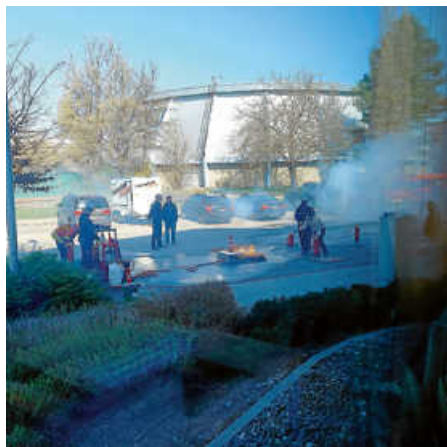
Die freiwillige Feuerwehr bei der Katastrophenschutzübung

Statt normalem Unterricht konnten alle Schülerinnen und Schüler am Mittwoch vor den Ferien innerhalb oder außerhalb der Schule Einblicke in viele verschiedene Berufe bekommen oder Beratungsangebote wahrnehmen. Das DRK und die Freiwillige Feuerwehr Bernhausen zeigten Katastrophenschutz live und gaben Einblicke in ihre Arbeit. Die Lerngruppen 10 fuhren an die FH Nürtingen für einen Workshop zur Studienberatung. Mehrere Eltern erzählten den Schülern aus den Lerngruppen 5 von ihren Berufen und ihrem Alltag. Ein Dank an alle, die uns einen Tag mit so vielen tollen Eindrücken und Erfahrungen ermöglichen! (N. Njezic)