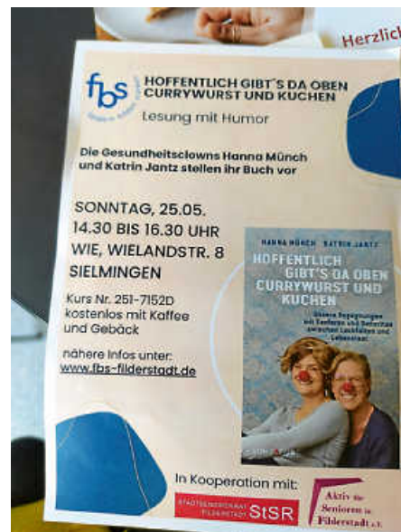
Plakat zur Lesung der Gesundheitsclowns.