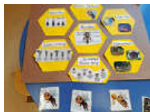
Informationen über Bienen