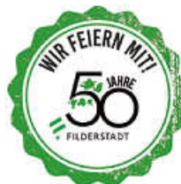
Logo: Stadt Filderstadt

Wir sind eine Vereinigung von 90 regionalen Künstlerinnen und Künstlern. In der Städtischen Galerie Filderstadt richten wir jährlich fünf Ausstellungen aus, für die sich alle Kunstschaffenden bewerben können. Bewerbungsschluss für das Ausstellungsjahr 2026 ist der 30. April 2025. (Michael Schmidt)