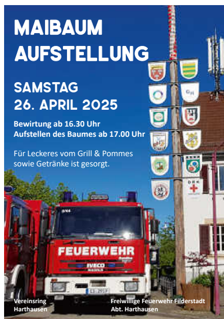
Plakat: Freiwillige Feuerwehr Abt. Harthausen