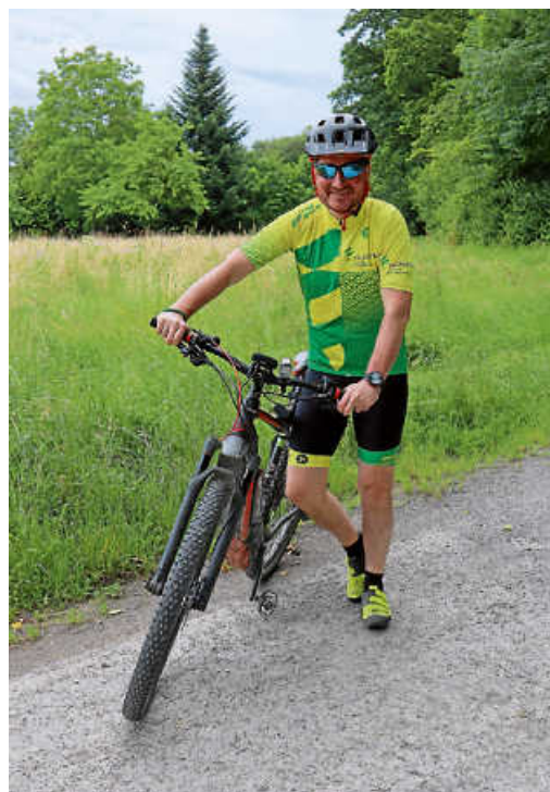
Auf die Pedale, fertig, los! Auch Oberbürgermeister Christoph Traub wird sich wieder am diesjährigen STADTRADELN beteiligen.