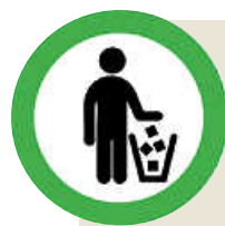
Tabelle: R. Scherle

BENUTZT DIE MÜLLEIMER DENKT AN DIE UMWELT