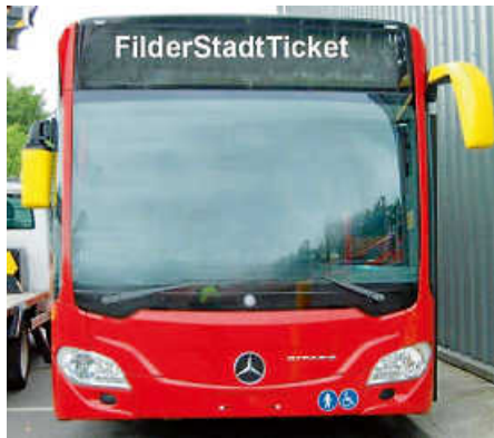
FilderStadtTicket ein Erfolgsmodell.