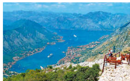
Kotor, Montenegro.

Kleines Land – großartiges Reiseziel. Multimedia-Radreisebericht mit Fotos und Videos einer 4-wöchigen Tour mit rund 1.000 Fahrrad km entlang der Adriaküste bis ins bergi-