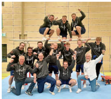
WKG-Meisterteam 2025.

Die Kunstturner der WKG Bonlanden/Sielmingen haben sich am vergangenen Samstag den Meistertitel in der Bezirksliga gesichert. Vor rund 100 Zuschauern ging es in der heimischen Halle gegen die WTG Heckengäu. Durch eine starke Leistung gewann das Team am Ende deutlich mit 257.55 zu 236.80 Punkten. Mit einer blitzsauberen Bilanz von vier Siegen steht die WKG somit im Ligafinale am 10.05. in Ludwigsburg . In diesem Relegationswettkampf geht es um den direkten Aufstieg in die Landesliga.