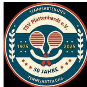
Logo: K. Lau

C-Juniorinnen: 18 Uhr TSV Steinhaldenfeld – TSV