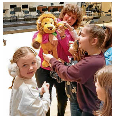
Der Besuch des FILUMS hat allen sehr viel Freude bereitet.