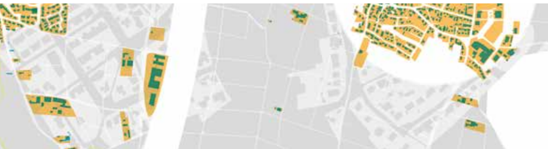
Abb.: Arbeitsprinzipien der Stadtteilkoordination