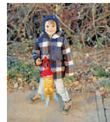
Bunte Raketen-Laterne.

Vergangene Woche trafen sich die Eckstein-Kinder mit ihren Eltern und Großeltern im Weilerhau und wir liefen gemeinsam mit unseren bunten Laternen durch den dunklen Wald und sangen dabei laut