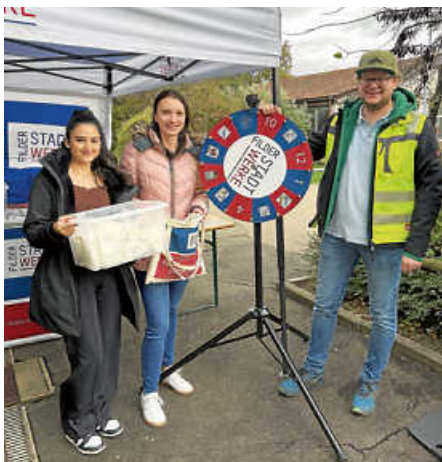
Spaß pur beim Filderstadtwerke-Team.