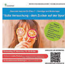
„Gesunden Impulse für Eltern?“ Plakat: Matthias Wieber