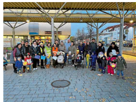
Treff am Bahnhof.