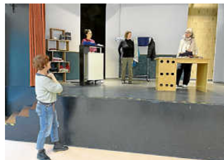
Regisseurin in Aktion.

Ob das „Kaufhaus in Trouble“ aus diesem Schlamassel wieder herauskommt? Tickets für die Premiere am 07. Februar 2026 gibt es unter https://filderbuehne.de/tickets/ .