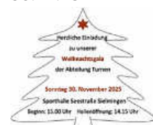
Grafik: D. Brachert laus schaut auch vorbei.

Herzliche Einladung in unsere Sporthalle zu begeisternden Auftritten rund um die Turnabteilung. Beginn 15 Uhr. Für leckere Bewirtung ist gesorgt, der Nikolaus schaut auch vorbei.