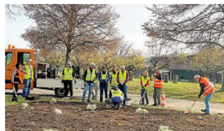
Filderstadt blüht und grünt.

Viele Freiwillige haben letzten Samstag in Filderstadt Blühflächen angelegt. In allen Stadtteilen wurden Flächen mit einheimischen, klima- und hitzeresistenten Pflanzen eingesät. Diese Blühwiesen bieten Insekten und Kleinstlebewesen wertvolle Lebensräume und helfen so gegen das dramatische Insektensterben.