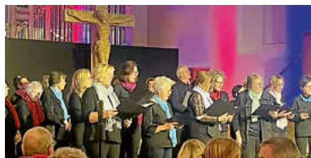
Auftritt des Sängerbundes bei der Church-night.