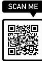
Zugangscode App.

Die App kann sowohl als Web-App im Browser genutzt werden, als auch in den App Stores heruntergeladen werden.