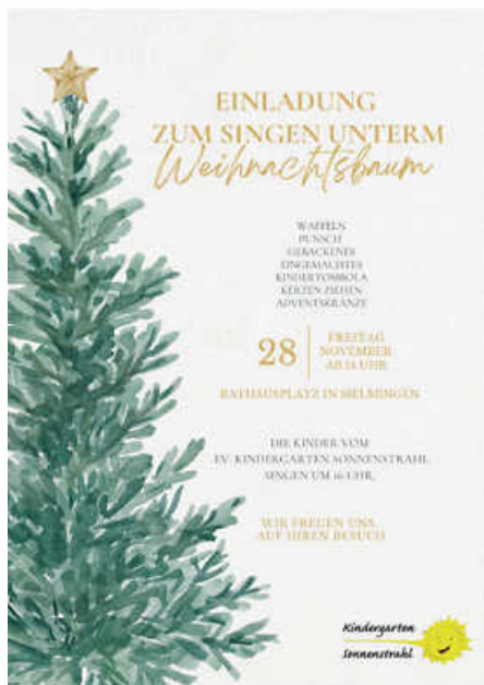
Plakat: Meike Auch

Herzliche Einladung! Die Kinder vom evangelischen Kindergarten Sonnenstrahl singen am 28.11., um 16 Uhr auf dem Rathausplatz und freuen sich auf viele Zuhörer. (Katrin Gebauer)