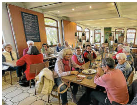
Seniorentreff im Hasenheim in Harthausen.