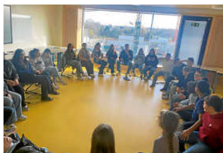
Unser wöchentlicher Klassenrat in der 6a.