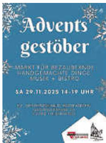
Plakat: CVJM Bonlanden e. V.

Tauche am Samstag, 29.11.2025 von 14 bis 19 Uhr ein in das Adventsgestöber, ein kleiner aber feiner Weihnachtsmarkt! In gemütlicher Atmosphäre laden festlich geschmückte Stände zum Stöbern ein und verzaubern mit besonderen handgemachten Schätzen. Weihnachtliche Gedanken und Anregungen werden rund um Gemeindehaus und Kirche geboten, Kaffee und Kuchen, Glühwein, Getränke und etwas vom Grill lassen den Gaumen verzaubern. Parallel dazu gibt es in der Kirche musikalische Beiträge zum Zuhören und Mitsingen.