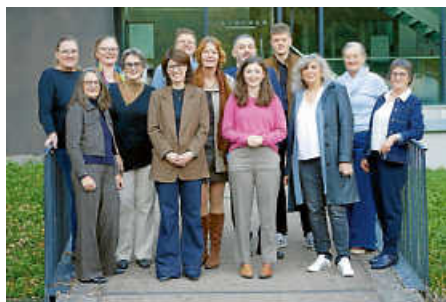
Die grüne Kreistagsfraktion.