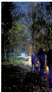
St. Martinsumzug.

Unser St. Martinsumzug sorgte auch dieses Jahr für eine tolle Atmosphäre. Nach einem kleinen St. Martinsspiel zogen die Kinder mit ihren selbstgebastelten Laternen los und brachten viel buntes Licht in den Plattenhardter Wald. Für die passende Begleitung zu unseren Laternenliedern sorgte Herr Medler mit seinem Blasinstrument. Es war ein schöner Abend, der allen viel Freude bereitet hat. (Tobias Großmann)