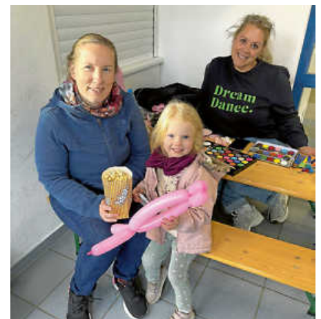
Gut besucht: das Kinderschminken.

Danke an alle, die das Hallenbad über die Jahre hinweg mit Leben gefüllt haben! (ih)