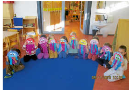
Laternenbasteln im Kindergarten Am Weilerhau.