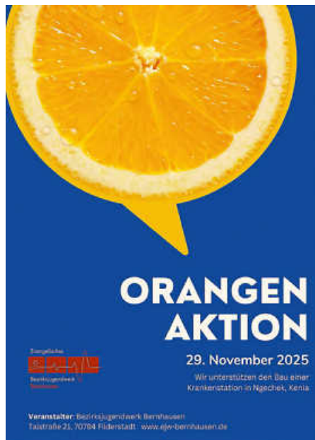
Plakat: Bezirksjugendwerk Bernhausen

Unsere Jungscharkinder und Konfirmandinnen verkaufen Orangen für den guten Zweck. Mit dem Erlös soll in Kenia eine Krankenstation für HIV-positive Kinder gebaut werden. Wollen Sie Orangen vorbestellen? Unter www.ejwp.de können Sie bestellen.