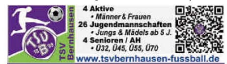
Grafik: R. Scherrle

Nach dem Derbysieg gegen Plattenhardt (2:0), steht am Samstag, 22.11. , um 14:30 Uhr gleich das nächste Filder-Derby beim FV Neuhausen auf dem Spielplan. Viel Glück lila Jungs und wieder kämpfen!