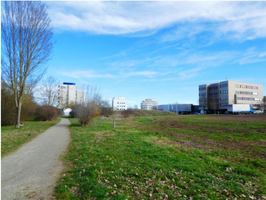
Abbildung 4: Grünland südlich Fußweg