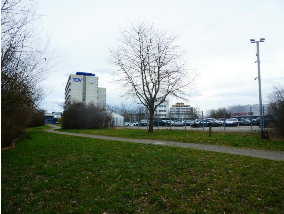
Abbildung 6: Fußweg südlich Fleinsbach mit Parkplatzfläche