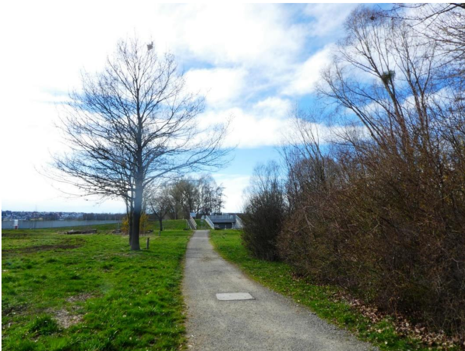
Abbildung 7: Fußweg südlich Fleinsbach mit Grünland im nordwestlichen Teil des Plangebets