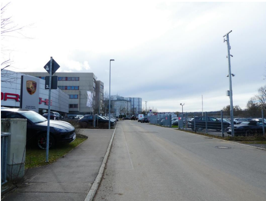
Abbildung 5: Karl-Benz-Straße, rechts Plangebiet mit Parkplatzfläche