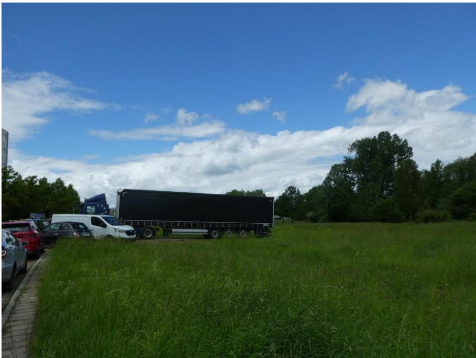
Abbildung 3: Grünland im nördlich Karl-Benz-Straße