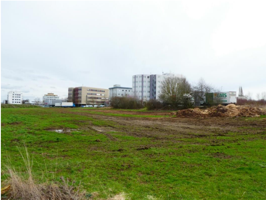
Abbildung 8: Grünland im westlichen Teil des Plangebiets