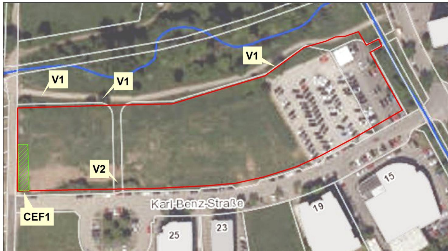
Karte 1: Plangebiet und Maßnahmen (s. Text)