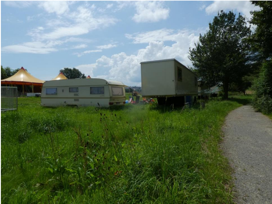
Abbildung 2: Grünland als Circus-Standplatz genutzt