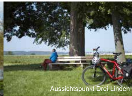
Aussichtspunkt Drei Linden