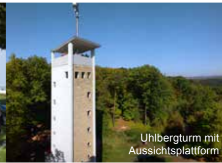
Uhlbergturm mit Aussichtsplattform