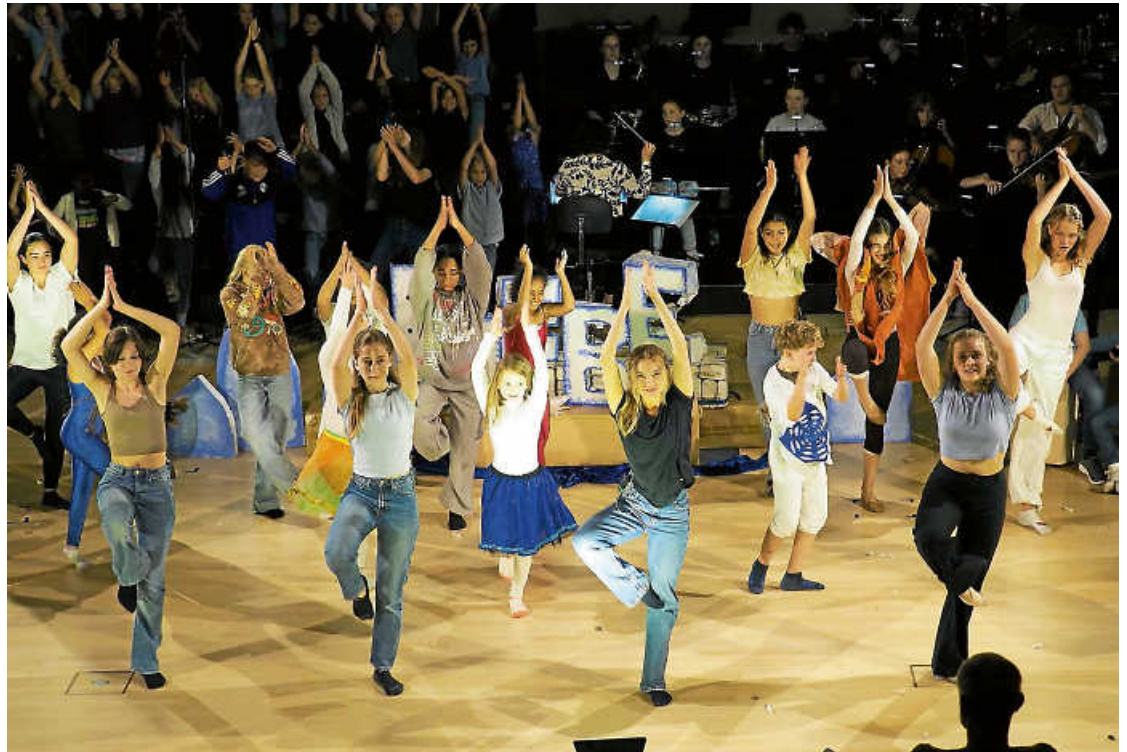
Gelungene Weltpremiere in Bernhausen: das Musical „Abenteuer hinter der Schranktür“.