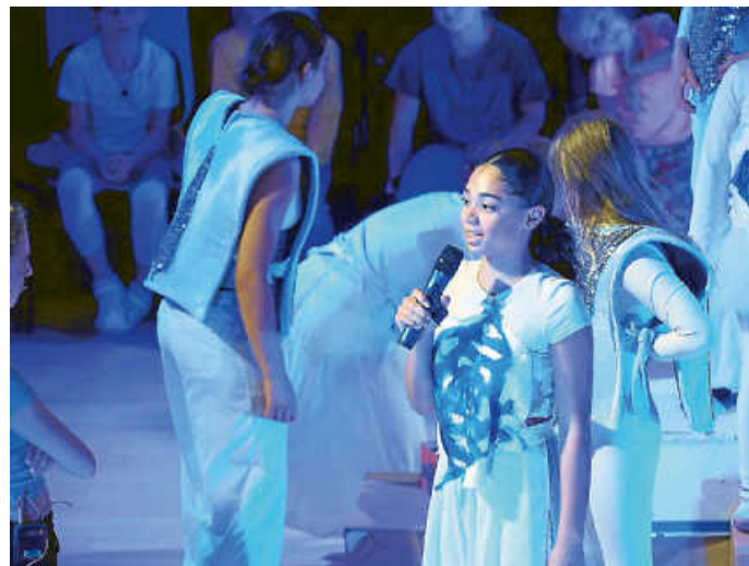
„Abenteuer hinter der Schranktür“ bescherte dem Publikum viele magische Gänsehaut-Momente.