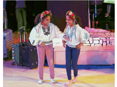
...mit viel Spaß dabei...