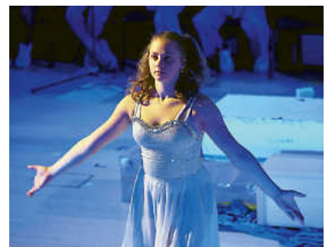
...die Welt um „Solveig“ wird eisig...