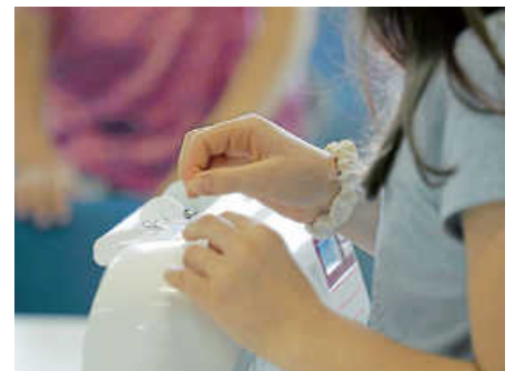
...Nähen mit Hand und der Maschine...