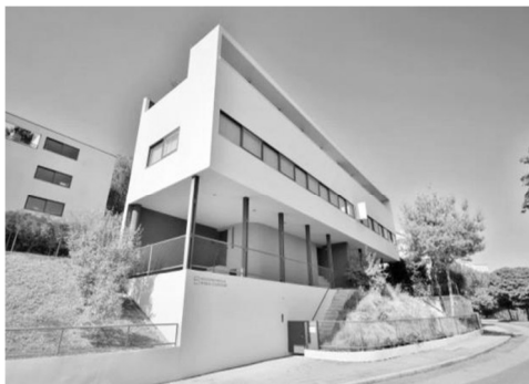
Weißenhofmuseum im Haus Le Corbusier